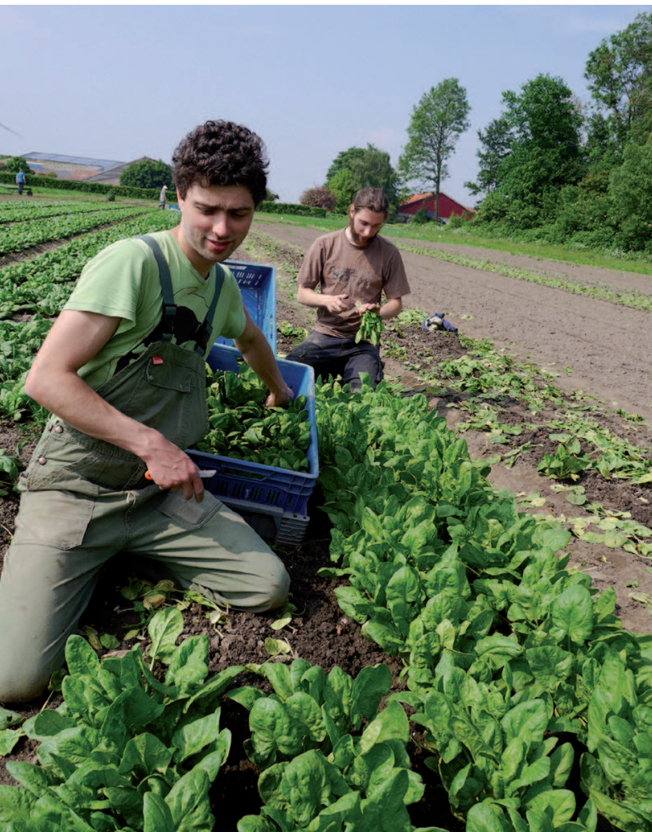
Studenten van Warmonderhof snijden spinazie op het land